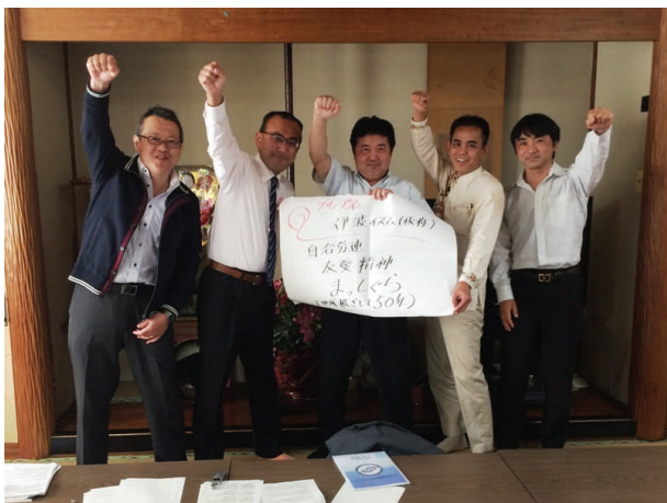
【チーム・仮称イハイズム】