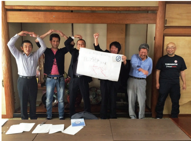
【チーム・ハブ酒に飲まれて嘯まれた会】

チーム「仮称イハイズム」 自由にして民主的な労働運動を実践しながら、組織拡大を図り、若い組合員を育成するとともに、自由な意見を提言できる環境を作り、相互による助け合い、福利厚生への充実を図り、職場の親睦を深めながら地域社会へ貢献できる組織を目指す。 ⑤「自治労連とは」を各グループで発表 チーム「ハブ酒に飲まれて嘯まれた会」 「自治労連とは友愛精神」 自治労連は友愛精神の一言に尽きる！