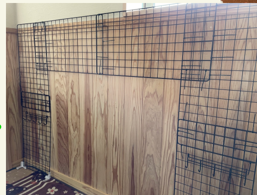
木柄の壁に穴を開けたくないの で、ネット6枚を組み上げてフレームを作成!