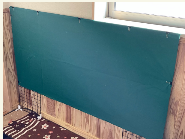
フレームに緑色のテーブルクロスをクリップで留めて完成♪(^o^)*♪